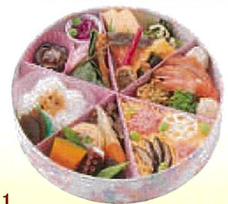
No.511 花ぐるま φ21.5 cm ¥2,400