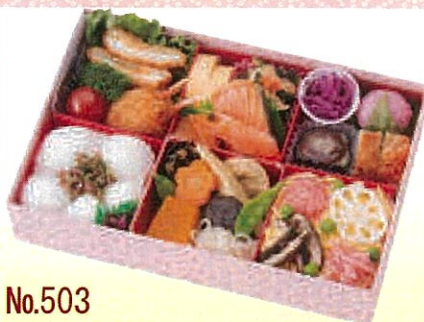
No.503 花かすり 25.0×17.0 cm ¥1,600