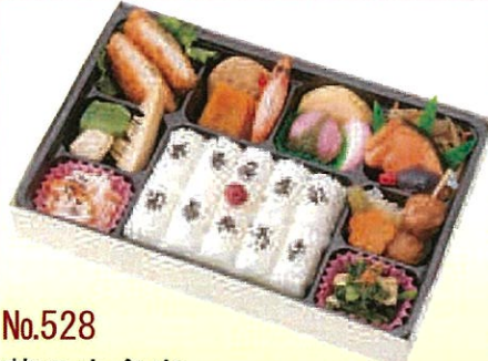
No.528 幕の内弁当 27.6×18.2 cm ¥1,100