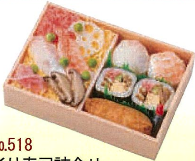
No.518 彩り寿司詰合せ 17.0×11.5 cm ¥750