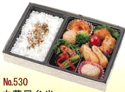
No.530 中華風弁当 27.6×18.2 cm ¥1,100