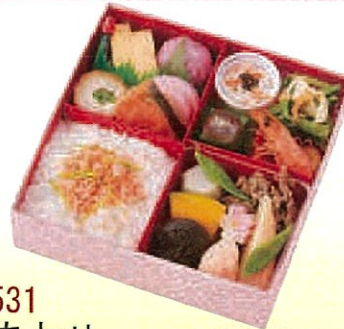
No.531 花あわせ 17.4×17.4 cm ¥1,100