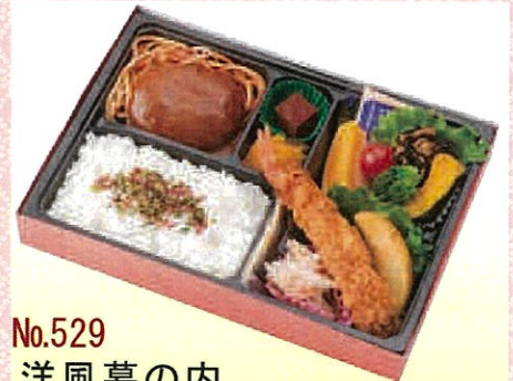
No.529 洋風幕の内 27.5×19.0 cm ¥1,100