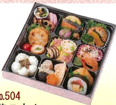
No.504 花こもん 25.0×25.0 cm ¥1,400