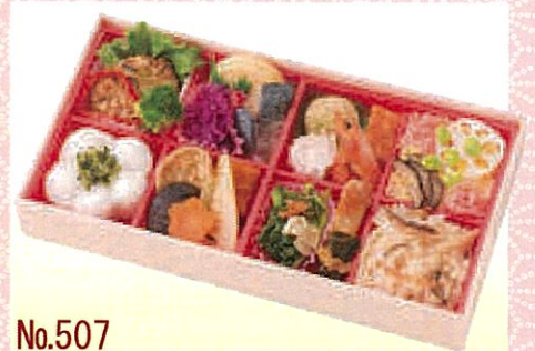
No.507 すみれ 30.0×16.0 cm ¥1,300